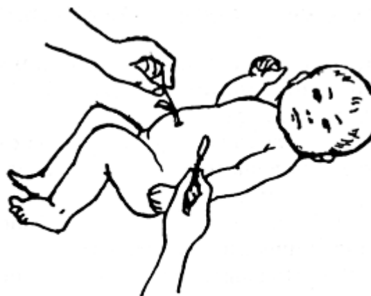
Рис. 10. Туалет пуповинного остатка

14. После обработки остатка этой же палочкой обработать кожу вокруг него от центра к периферии. Другой палочкой с ватным тампоном, смоченным 5 % раствором калия перманганата, обработать пуповинный остаток в той же последовательности, не касаясь кожи живота.