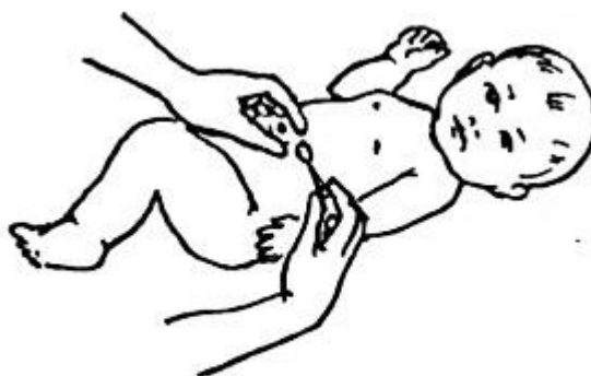
Рис. 11. Туалет пупочной ранки