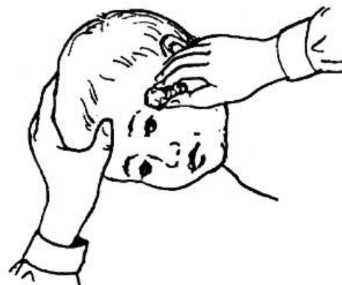
Рис. 6. Промывание глаз с фиксацией головы