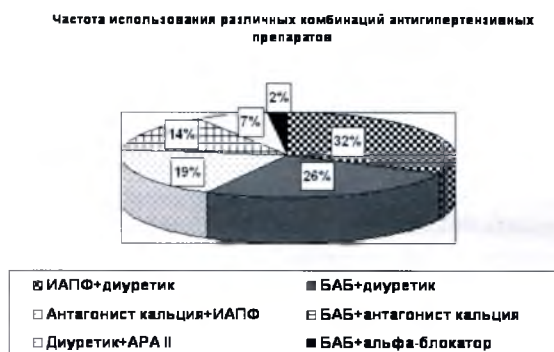
Рисунок 1. Результаты российских фармакоэпидемиологических исследований

- комбинация высокоэффективна за счет синергизма действия и преодоления толерантности [8].